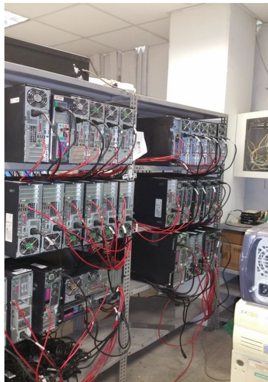
FIGURA 2: CANCELLAZIONE DATI IN SDE A USMATE VELATE