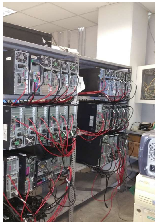
FIGURA 1: CANCELLAZIONE DATI PRESSO LA NOSTRA SEDE